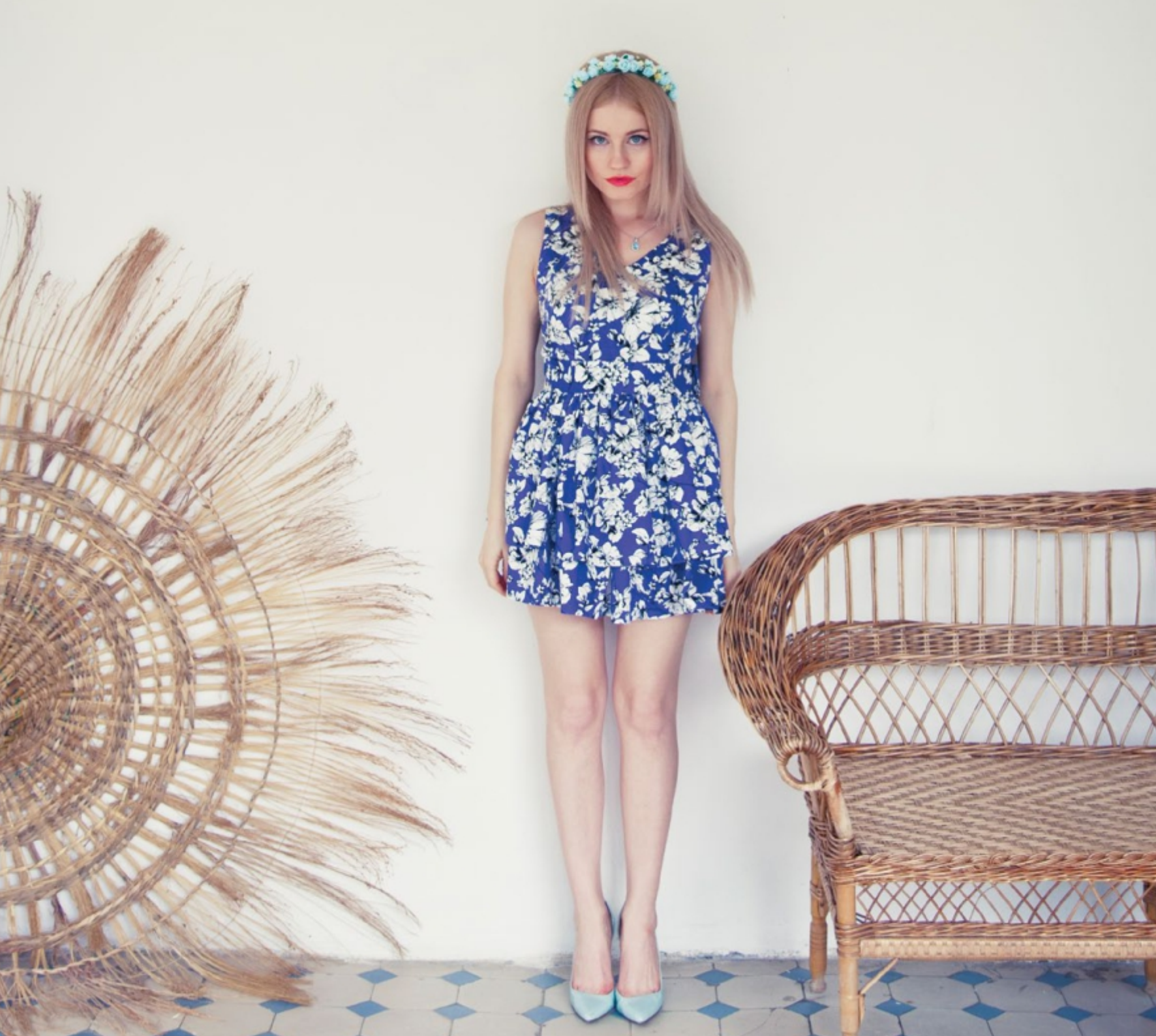
Платье "Сон двадцать второй. Свидание. Букет синих цветов.. Лето" для летних прогулок. Арт. 5023