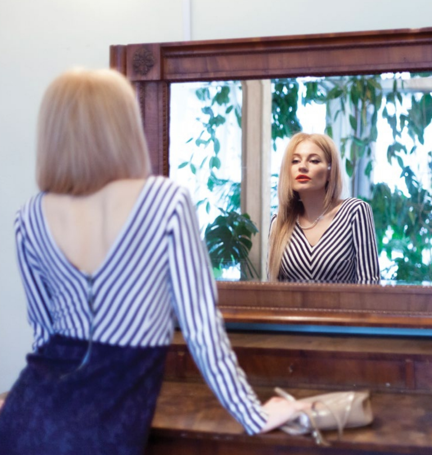
Платье "Сон двадцатый. Море. Играет музыка. Подарок" для торжественного вечера и комфортного отдыха. Арт. 5021