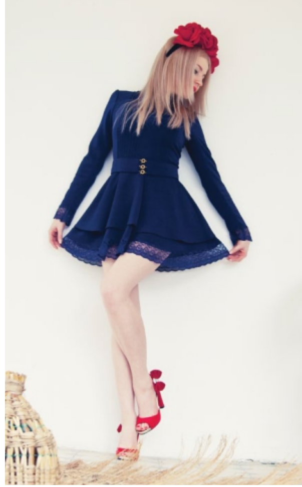
Платье "Сон двадцать четвертый. Ночная прогулка" для вечерних прогулок. Арт. 5025