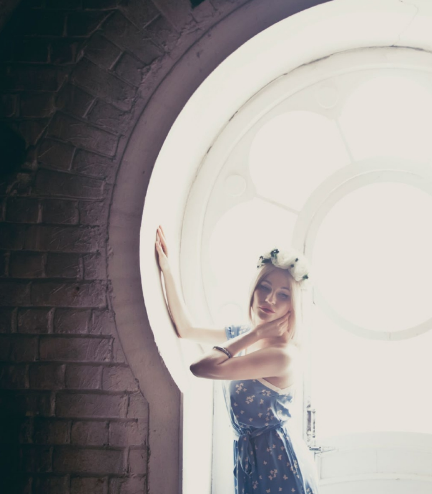
Платье "Сон семнадцатый. Мотылек. Ветер в лицо. Дождь" для летней прогулки или праздничного события. Арт. 5018