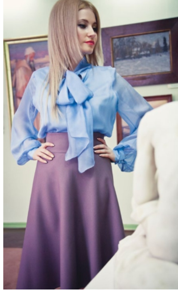
Юбка (Арт. 5006) и блуза (Арт. 5007) для деловых встреч "Сон Шестой. Воздух Грасса. Помню твой взгляд"