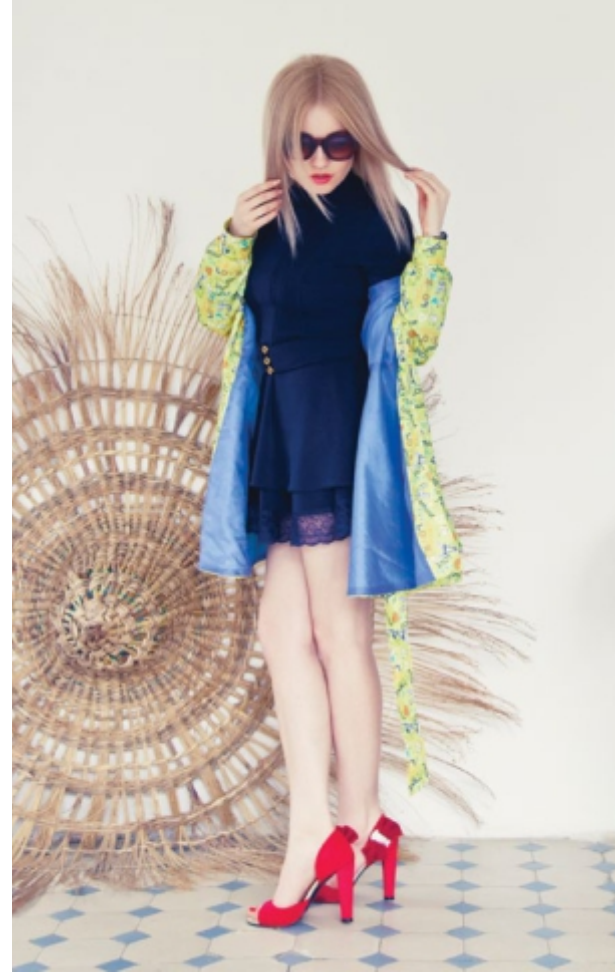
Плащик "Сон двадцать седьмой. Имбирный лимонад. Веранда" для знойного вечера и дождливого дня. Арт. 5028