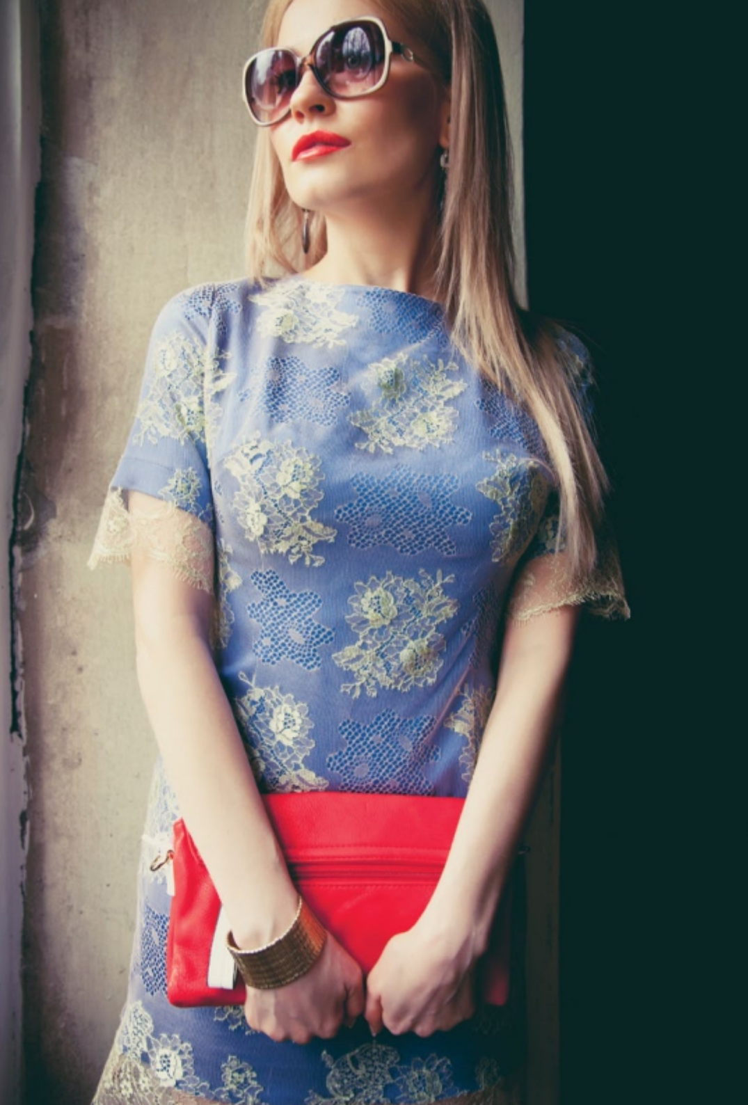
Платье "Сон двеннаццатый. Кружево..." Для праздничного события. Арт. 5013