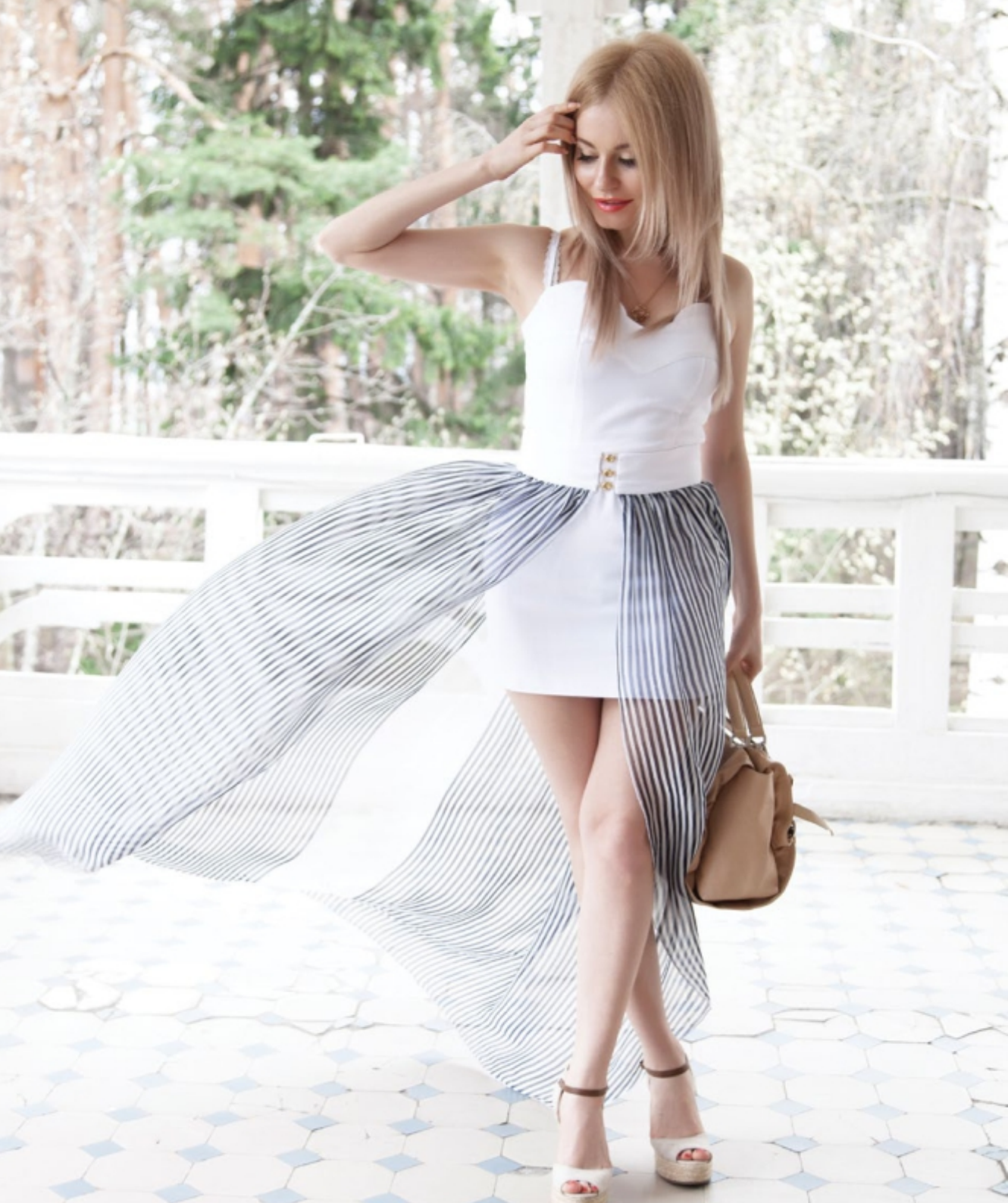
Платье "Сон Четырнадцатый. Шелковая игра" для праздничного события и летних прогулок. Арт. 5015