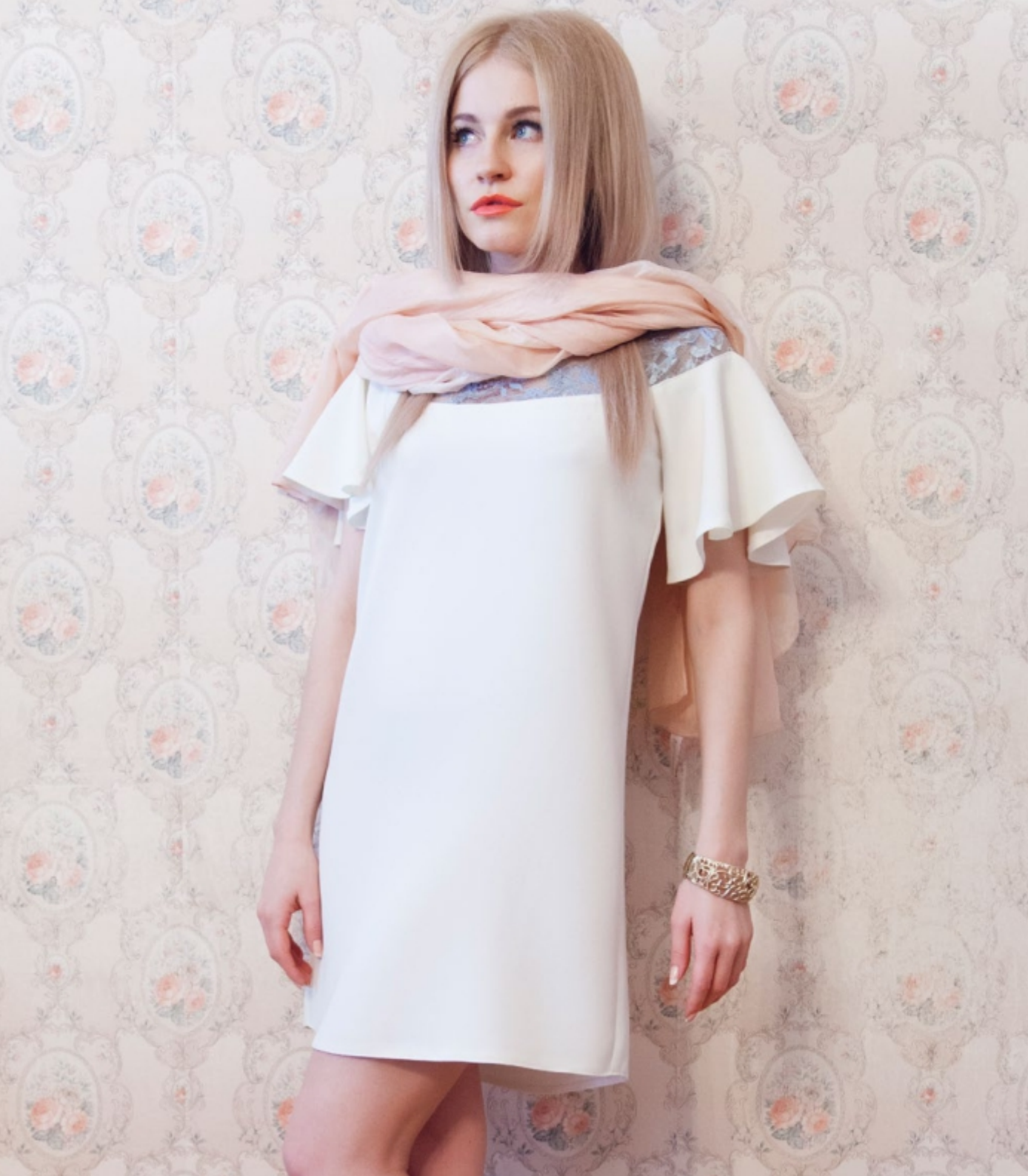
Платье "Сон седьмой. Увлечение. Смелость в действии" для праздничного ужина. Арт. 5008