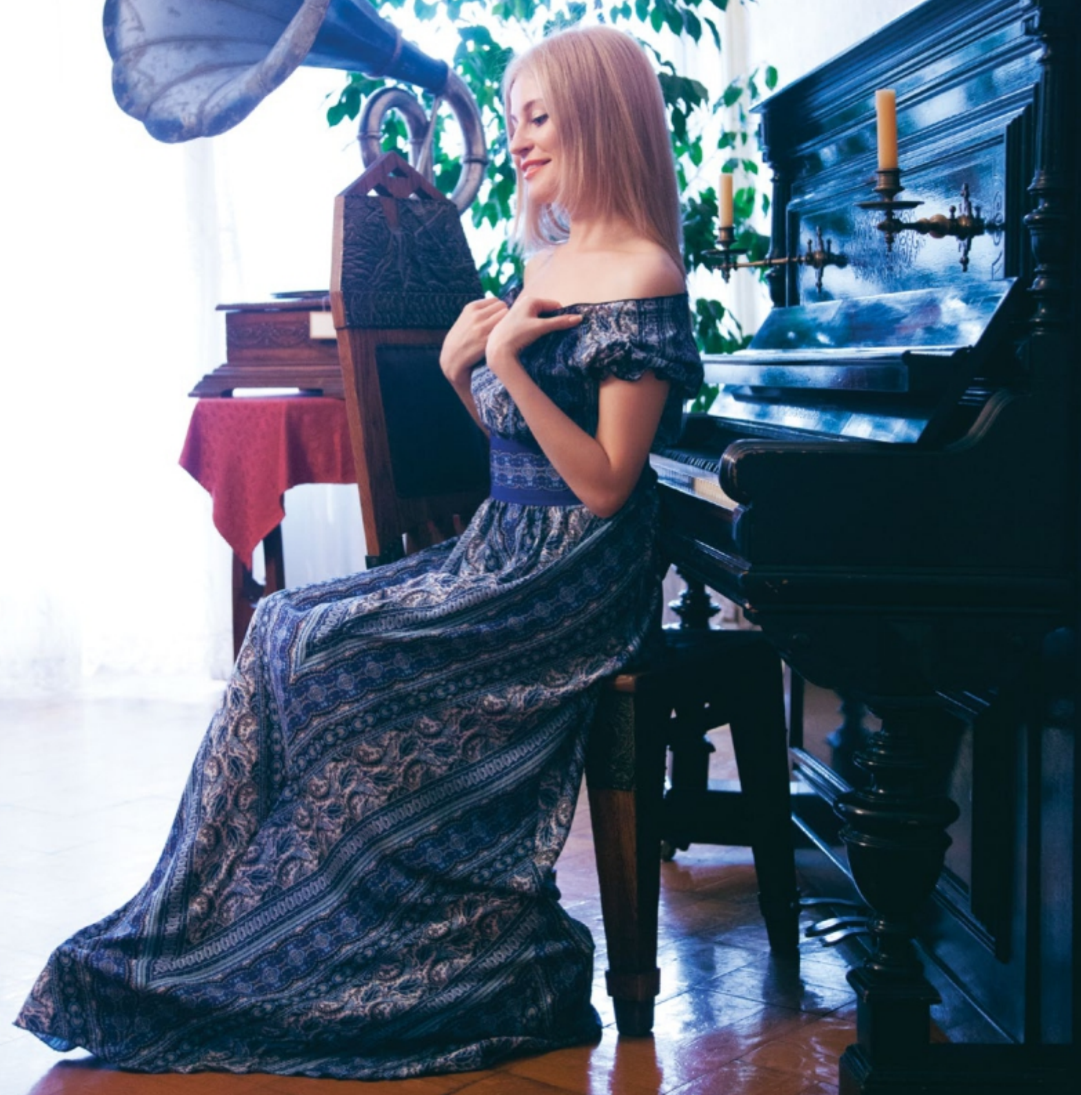
Платье "Сон одиннадцатый. Приятельность" для летних прогулок. Арт. 5012