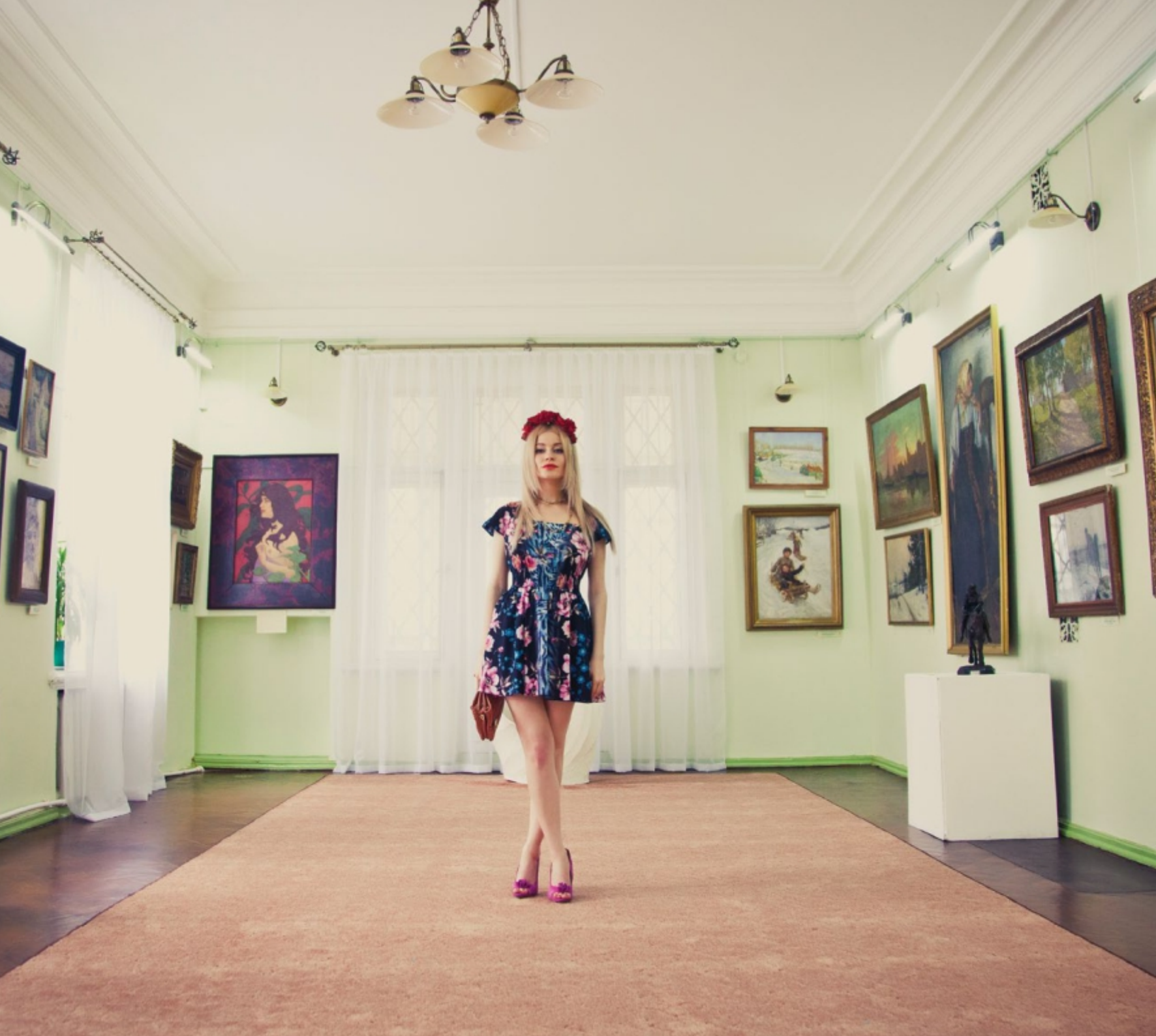
Платье «Сон первый. Фрукты на столе. Изобилие» для летней прогулки. Арт. 5001